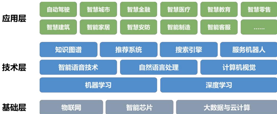
图 1 人工智能技术架构

根据工业和信息化部人才交流中心2019年9月发布的人工智能产业人才岗位能力标准，基于机器学习和深度学习的人工智能技术架构主要依托计算机技术体系实现。技术架构自底向上依次为基础层、技术层和应用层，具体结构如下图1所示：