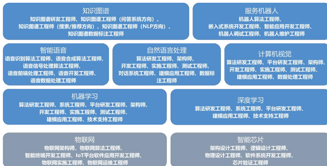
图 2 人工智能行业细分领域重点岗位分析

人工智能产业的稳步发展一方面加速了技术革新的进程，同时在产业人才需求上也催生出众多的人工智能相关岗位。基于人工智能产业技术架构以及人工智能企业的实际用人需求，针对技术架构中基础层和技术层涵盖的人工智能岗位进行归纳梳理，在本标准中涉及到以下细分领域的重点岗位，具体如图 2 所示。